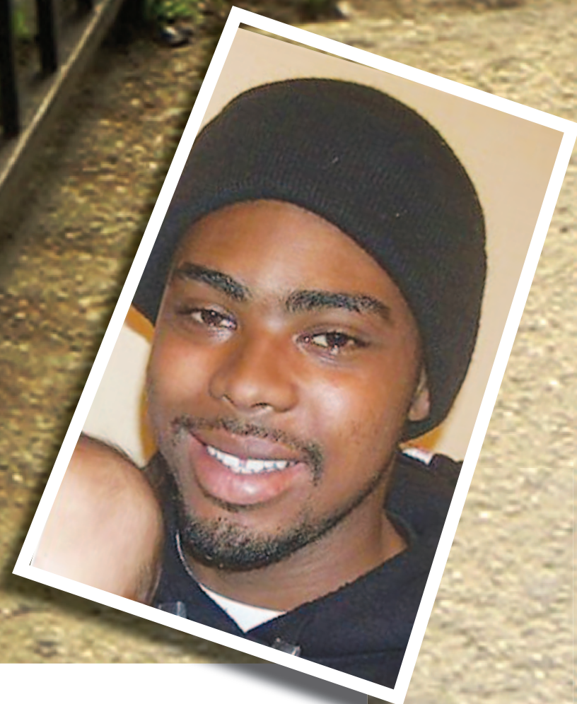
Oscar Grant, 22. Muerto por la policía del BART, Oakland, 1 enero 2009. En el camino a su casa después de celebrar el año nuevo, unos policías lo golpearon y empujaron al suelo. Al estar bocaabajo en el andén, un policía lo baleó por la espalda.