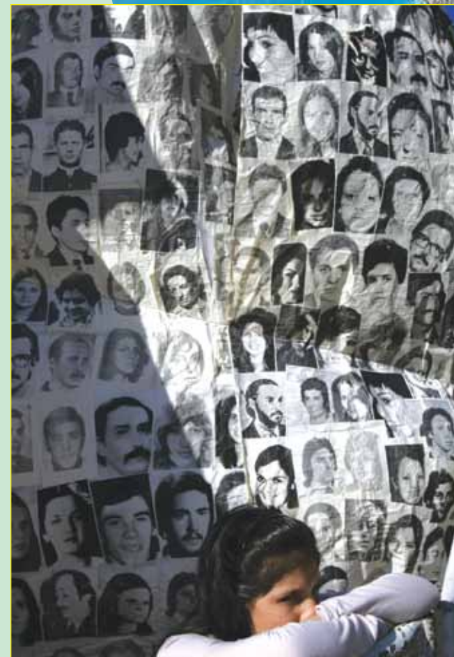
Abril de 2007, Argentina. Una muestra de fotos conmemorativas de los desaparecidos durante la "Guerra Sucia" de 1976 a 1983.

2 Argentina 1976 a 1983: En los años 1970, EE.UU. estaba bajo la presión en todo el mundo de sus rivales imperialistas de la Unión Soviética, antes socialista pero ahora imperialista. Lo que molestaba en particular a los gobernantes norteamericanos era la creciente influencia soviética en América Central y del Sur, regiones por mucho tiempo consideradas su "patio trasero". Para contrarrestar la presencia soviética, los organismos de inteligencia yanquis tramaron "Operación Cóndor", una campaña de terror y represión política en el "cono sur" de Sudamérica, Argentina incluida. En 1976, la junta militar de Argentina comenzó un reino de terror conocido como la "guerra sucia". El secretario de Estado de EE. UU. Henry Kissinger dijo en una reunión de generales argentinos: "Si existen cosas que hay que hacer, ustedes tienen que hacerlas rápidamente". En la pesadilla que siguió, secuestraron, torturaron y "desaparecieron" hasta 30.000 personas. Singularizaron a estudiantes, intelectuales, sindicalistas, izquierdistas e individuos sindicados de ser guerrilleros armados. El punto de vista pro-nazi y antisemita generalizado en el ejército produjo "una brutalidad particular en el trato de presos de origen judío". No obstante, en ese período y bajo la dirección de la batuta yanqui, Israel se hizo uno de los proveedores de armas más grandes de Argentina, suministrando cazas de combate, misiles, lanchas de patrulla, repuestos, armas ligeras y municiones.