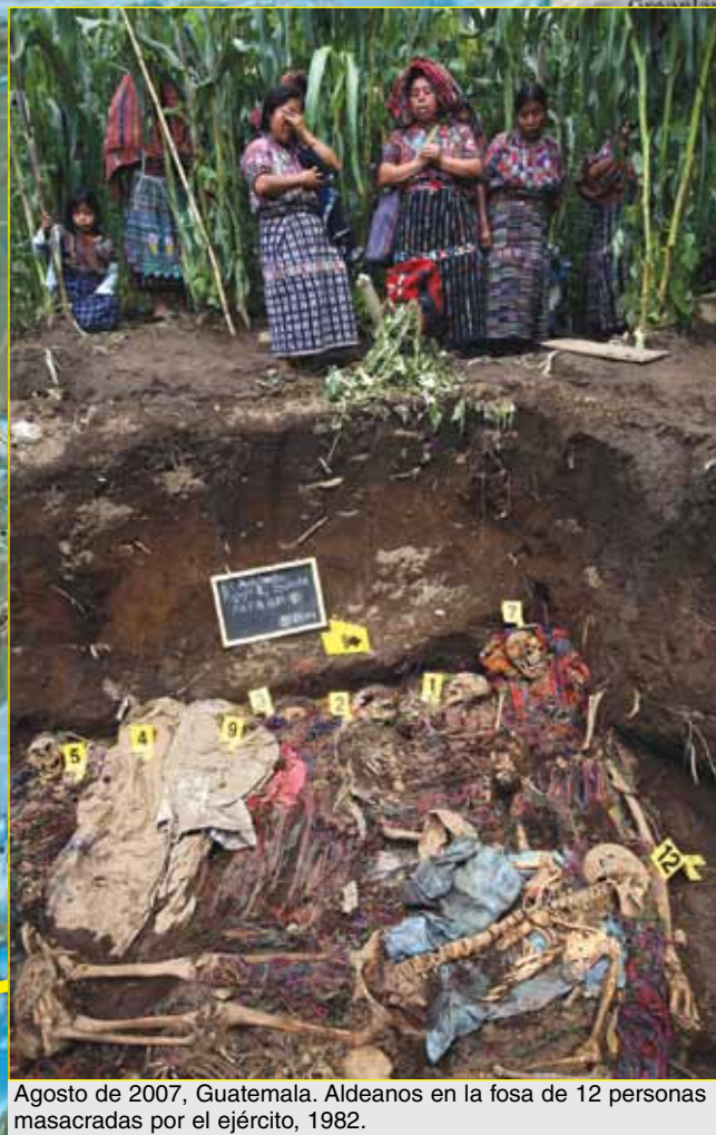
Agosto de 2007, Guatemala. Aldeanos en la fosa de 12 personas masacradas por el ejército, 1982.