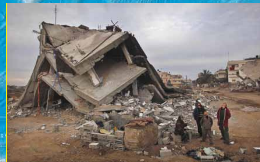
28 de enero de 2009, unos palestinos en los escombros de su casa en el pueblo gazono de Jebaliya observan la llegada de los aviones no tripulados israelíes.

3 Irán 1967 a 1986: Un golpe de estado urdido por EE.UU. en 1953 instauró en el poder al Sha de Irán. Éste fue un tirano brutal que convirtió a Irán, un país rico en petróleo con una ubicación estratégica, en un cliente del imperialismo yanqui. Empezando a fines de los 1950, Mossad, el organismo de inteligencia israelí, desempeñaba un importante rol en entrenar al Savak, la policía política de brutal fama del Sha. Savak torturó y asesinó a miles de iraníes. Tras las guerras de Israel contra sus vecinos en 1967 y 1973 y mientras la oposición al régimen del Sha ardía por todo el país, el "Proyecto Flor" de Israel envió hasta $500 millones de equipo militar y policial a Irán.