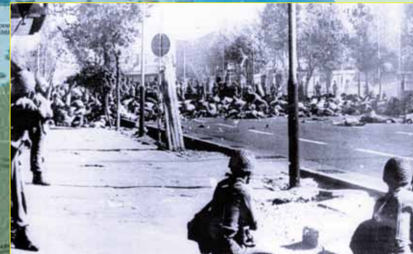
8 de septiembre de 1978, Teherán, Irán. "Viernes Negro". Los soldados del Sha abrieron fuego sobre los manifestantes y dejaron cientos de muertos.