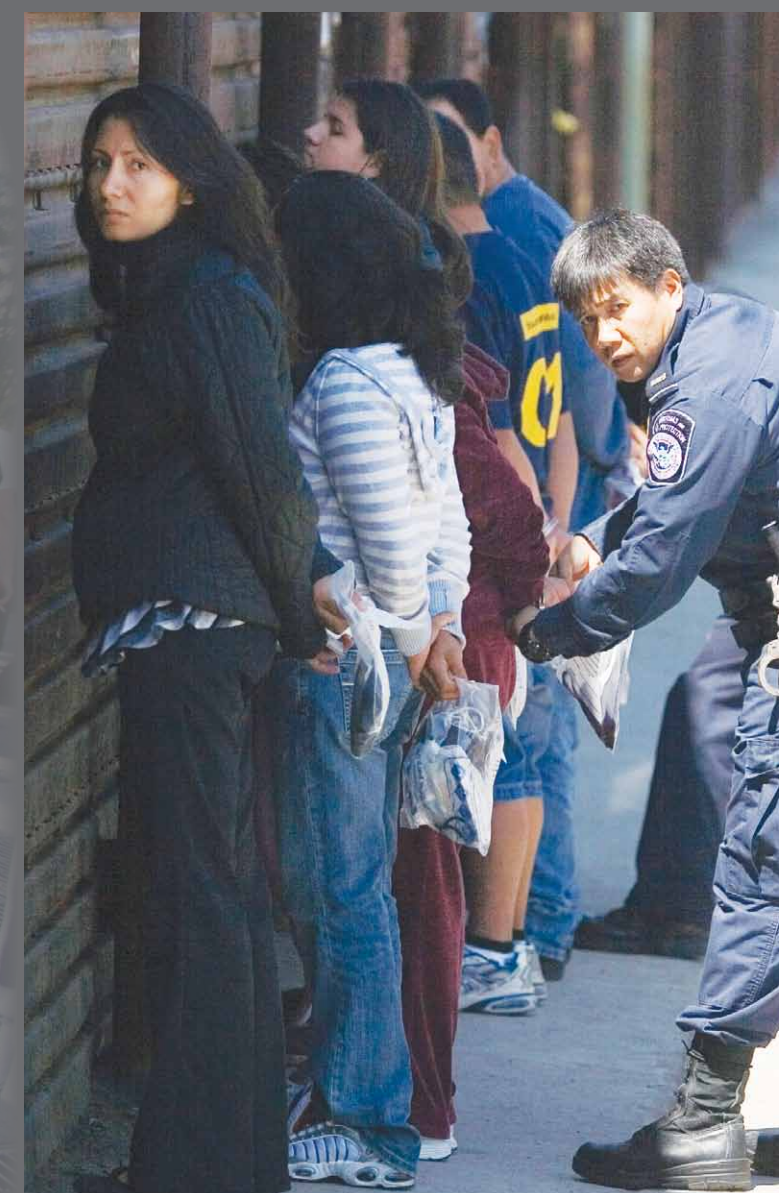
Arriba: Inmigrantes en proceso de deportación, 2008. (Foto: AP) Arriba, izquierda: Cárcel hacinada, California, 2007. (Foto: AP) Abajo, izquierda: Acción del 22 de octubre de 2009, Nueva York. (Foto: Li Onesto/Revolución) Centro: Fuera del juicio del policía que mató a Oscar Grant, 2010. (Foto: AP)

Lo siguiente es del Mensaje y Llamamiento del Partido Comunista Revolucionario, Estados Unidos, "La revolución que necesitamos... La dirección que tenemos", en línea en revcom.us :