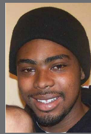
Oscar Grant Oakland, CA 2009